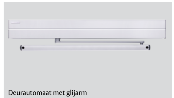
Deurautomaat met glijarm