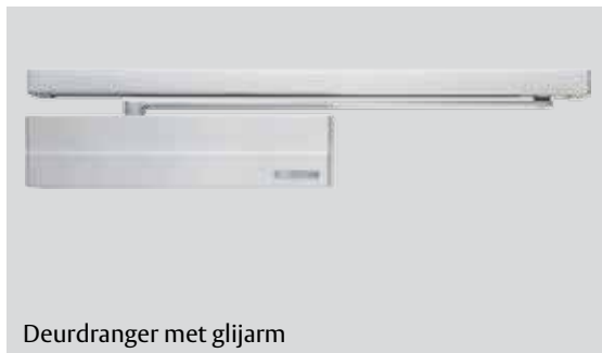
Deurdranger met glijarm